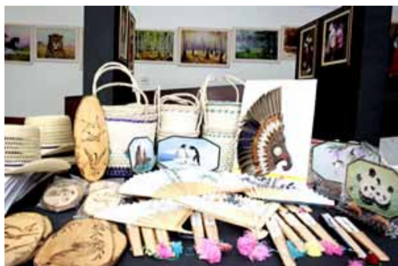
Artesanato em exposição na Galeria de Arte do TBV

Brasília, Distrito Federal, Brasil — A Galeria de Arte, do Templo da Boa Vontade (TBV), a Pirâmide das Almas Benditas, abriga desde quarta-feira, 7 de Julho, uma exposição sobre a Coreia do Norte. O monumento ecuménico é o mais visitado da capital federal, segundo dados oficiais da Secretaria de Desenvolvimento Económico e Turismo do Distrito Federal (SDET).